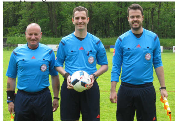
Sorridenti prima e dopo la partita...