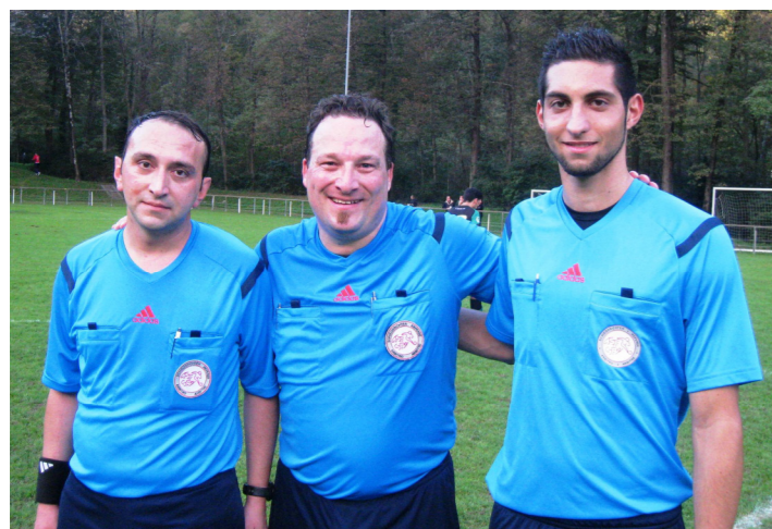
La miglior terna arbitrale, proveniente dalla Svizzera tedesca, ammirata alla Pineta quest'anno, nel girone d'andata in 2a lega

Ricordi "Sulla piazza del paese, al campetto dell'oratorio o in mezzo alla strada del quartiere in periferia si gioca a calcio con entusiasmo, in tre o quattro per parte, con piccole porte improvvisate, due bidoni di metallo, senza portiere, ma soprattutto senza arbitro . Le regole sono stabilite all'inizio di comune accordo, ma poi le decisioni sono prese urlando, a volte con discussioni animate e infinite che si concludono con il classico "Bon a giùghi pü, a vò a cà!" E chi va a casa è il "padrone" del pallone che va a casa con lui, così finisce il gioco!"