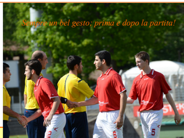
Sempre un bel gesto; prima e dopo la partita!