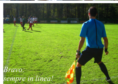
Bravo: sempre in linea!